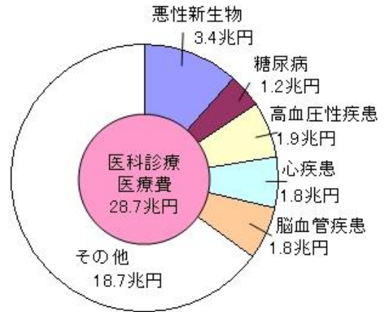
生活習慣病と医科診療医療費

など、食生活や運動などの生活習慣とこれらの疾患の関係が明らかになり、健康診断などによる早期発見・早期治療という二次予防に重点を置いていた従来の対策に加え、生活習慣の改善により発症そのものを予防するという一次予防対策も推進していく方針が「生活習慣病」という言葉に表されています。